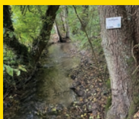
Les contrats de rivière p.13