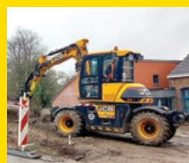
Nouveau parking pour l'école de Limont p.17