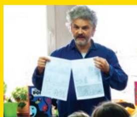
Fureur de Lire 2025 à la bibliothèque p.11